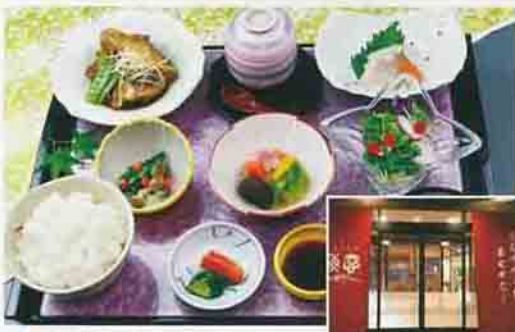
▲写真は、日替り「和膳」

今年7月、柳川市大和町に新規オープンした割烹料理「海宴」は、山海の素材を活かした料理をメインにメニューも豊富で、日替りの「和膳」や海の幸たっぷりの「海宴井御膳」が人気です。個室で食事が楽しめるほか、慶行事、ご法要、各種ご宴会にも利用できるお部屋を準備しています。