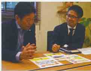
▲打ち合わせをする会長と事務局長