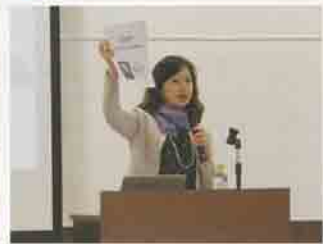
▲専門家による講演

「遺言・相続勉強会」、8月は「防犯・防災研修会」、11月は「税」の勉強会」とテーマを変えて終活に関わる情報を提供し、無料相談会と併せて回を重ねる。 イベントは来年1月にも予定。定期的に開き続け、「ここにすれば何かしら答えがあるのでは」と信頼につなげ、活動を広げる。「終活を学びながら、楽しい部分もつくりたいか」と知恵を出し合い、安心のまちづくりへノウハウを生かす。