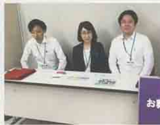
▲白雲社による無料相談会